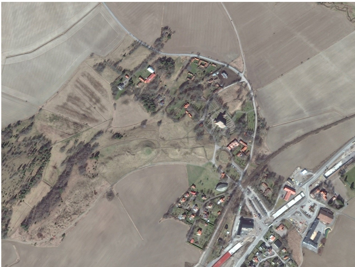
Abbildung 2. Luftbild von Alt-Uppsala (, Stand 23.02.2017).